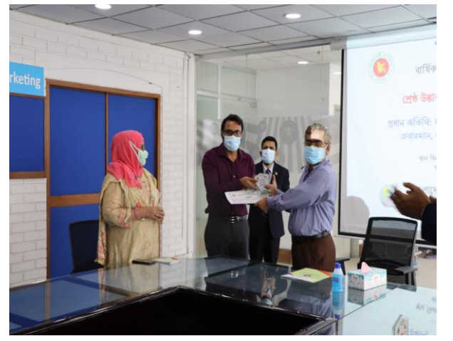
শ্রেষ্ঠ উদ্ভাবকগণকে পুরস্কার প্রদান